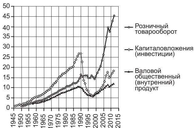
Рис. 1. Индексы физического объема оборота розничной торговли, капиталовложений (инвестиций) и валового общественного (внутреннего) продукта в РСФСР и РФ (1950 г.=1)

Вот динамика некоторых показателей. На рис. 1 показаны индексы инвестиций в основные фонды (базу экономики), годового ВВП (производства товаров и услуг), уровня совокупного потребления населения, отраженного в розничном товарообороте. На двух других рисунках — индексы объема производства промышленности и сельского хозяйства.